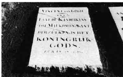
Overlijdensakte levenloos kind van Theodorus van Gogh (1852)