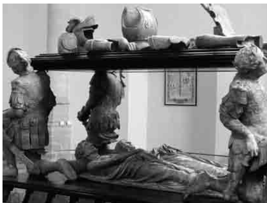
Nogmaals het praalgraf in de Bredase kerk

Verzamelen voor de fietstocht in gemeenschapshuis Vianden, Viandenlaan 3, 4835 EG Breda-Ginneken. Ontvangst met koffie/thee. Parkeergelegenheid op het nabijgelegen Schoolakkerplein (gratis).