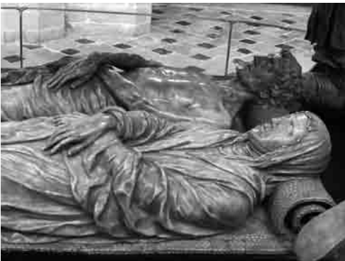
Het praelgraf van Engelbrecht II van Nassau in de Grote Kerk