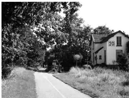
Het Bels Lijntje bij Baarle is nu als fietspad nog zichtbaar.