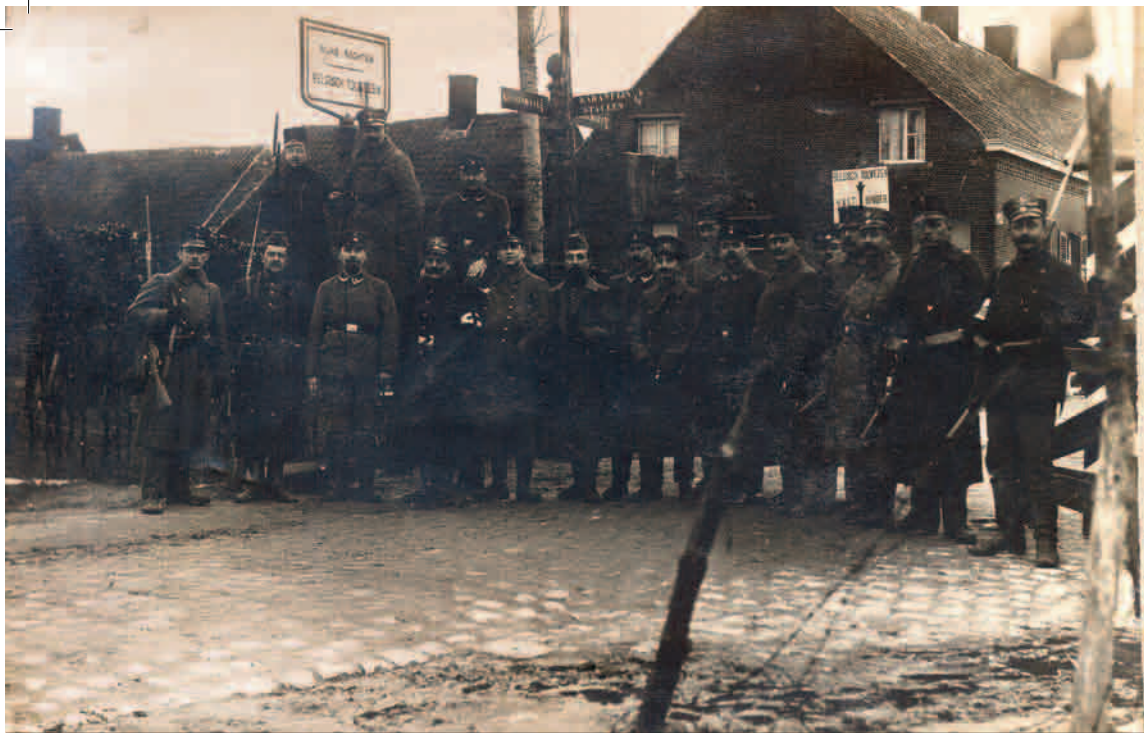
Een foto uit de Eerste Wereldoorlog gemaakt aan de Belgische grens bij Essen

Brabants Heem wil de ondersteunende organisatie zijn voor 126 zelfstandige, Brabantse heemkundekringen. De stichting organiseert cursussen en studiedagen, zet netwerken op en geeft adviezen. Dat alles om de deskundigheid van de kringleden te bevorderen op alle terreinen waar dat nodig is. Verder stimuleert Brabants Heem nieuwe initiatieven en onderlinge samenwerking. Brabants Heem: van vrijwilligers voor vrijwilligers.