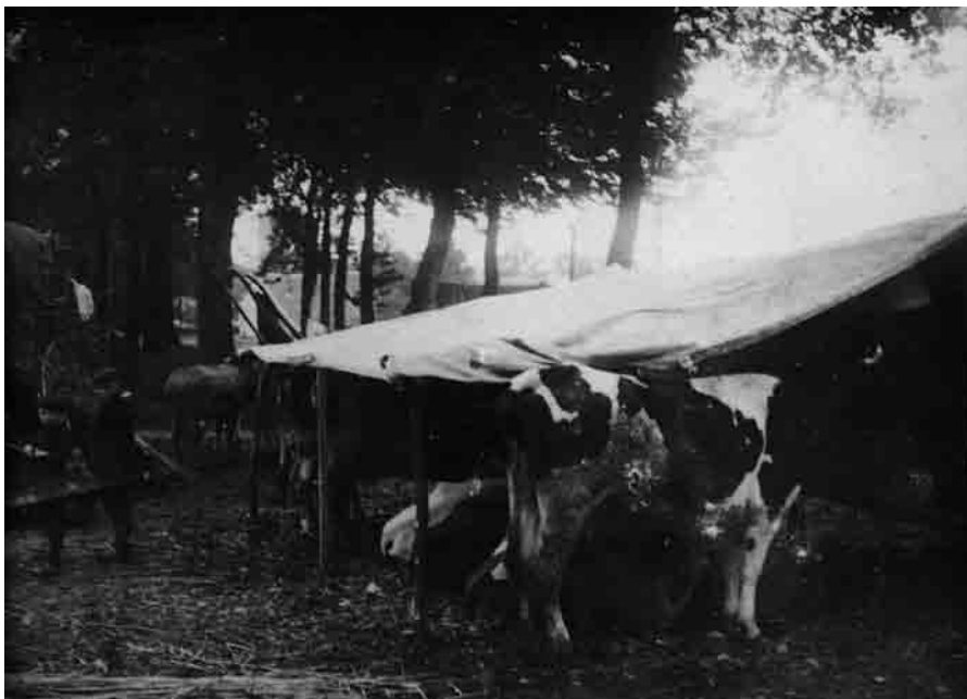
Belgische vluchtelingen met hun koeien

volgen van de oorlogsgebeurtenissen op de plaatselijke bevolking. Met andere woorden het verhaal van onze mensen onder de kerktoren, hun pijn en smarten, de honger, de vlucht, de ontheemding.