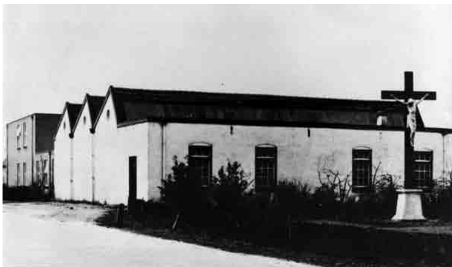
Confectieatelier Milo in Mierlo-Hout