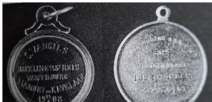
De medailles die Cees kreeg voor 25 en 50 jaar

Cees aanvaardde zijn leven lang zijn lot en bleef een goed gehumeurd mens; altijd liedjes zingend en