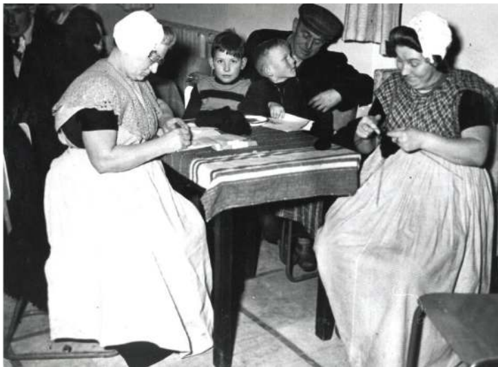
Opvangcentrum ingericht in kamp Prinsbosch

Op donderdag arriveerden nog meer evacués in de gemeente vanuit Breda, waar toen zo'n 12.000 mensen uit de noodgebieden verbleven. De burgemeester gebruikte daarbij de term 'stortvloed', een merkwaardige woordspeling. Deze mensen werden verspreid over de opvanglocaties ondergebracht en bij mensen in de dorpen die zich daarvoor hadden aangemeld. In totaal werden ruim duizend evacués in onze gemeente opgevangen, waarvan ongeveer honderdvijftig bij inwoners in huis.