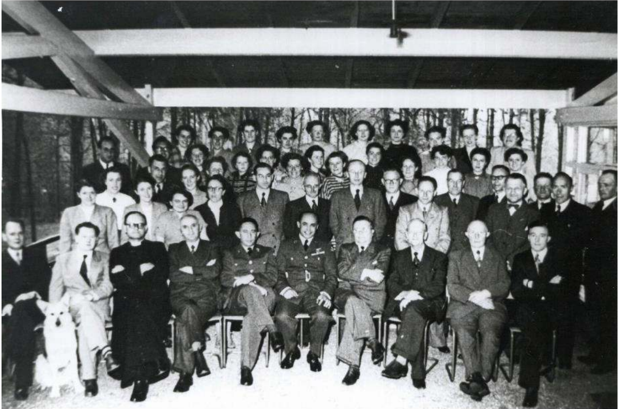
Grote groep vrijwilligers die hielpen bij de opvang van evacués, met legerleiding, geestelijke zorg en burgemeester. Foto is vermoedelijk genomen bij het Kinderkamp te Rijen.

Zo droeg Gilze en Rijen een belangrijk steentje bij in februari 1953. Maar niet alleen getroffen landgenoten werden hier geholpen. Bij de watersnoodramp verdronken tienduizenden dieren. Ook gered vee vond onderdak in de gemeente. Daarvoor werden etensresten en schillen als veevoer bewaard. Al met al werd door de acties vanaf de vliegbasis én door de hulpvaardigheid van de inwoners hier, de naam van onze gemeente in heel Nederland bekend.