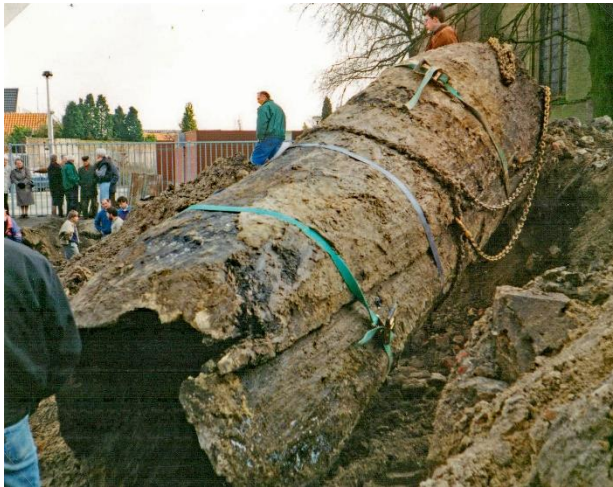
Boomput opgegraven bij de kerk van Gilze in 1994

Gilze is een van de oudste plaatsen in het Land van Breda. De naam duikt voor het eerst op in een schenkingsacte uit het jaar 992. In deze acte schenkt Hilsondis, gravin van Strijen, haar bezittingen, aangeduid met 'villa Gillesela' ofwel 'het dorp Gilze', aan de abdij van Thorn. Er is wel één 'maar'. Dit document van Hilsondis wordt al tientallen jaren voor onecht gehouden, maar inhoudelijk toch als waar aangemerkt. Hoe zit dat precies? Dat 'onecht' heeft te maken met de vorm, niet met de inhoud. De abdij van Thorn heeft volgens deskundig onderzoek de oorkonde pas in latere tijd opgesteld, maar wat er in staat wordt als waar aangenomen omdat het door andere bronnen wordt ondersteund. Zo is daar de kroniek van bisschop Thietmar van Merseburg, die van 975 tot 1018 leefde. Hij geeft ons informatie, onder andere over Thorn en Gilze, waaruit het jaartal 992 redelijk kan worden afgeleid. Dat Gilze meer dan duizend jaar oud is blijkt bovendien uit een boomput uit die