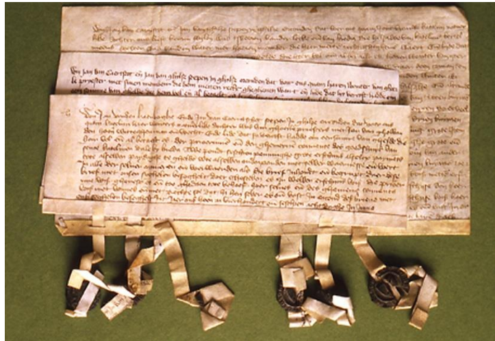
Acte en zegels uit 1404 met hierin de eerste vermelding van Rijen