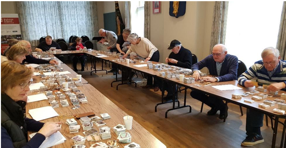
vrijwilligers bezig met het verzamelen van plaatjes voor de meer dan 350 ingeleverde lijstjes van onze inwoners.

Kortom een actie die niet alleen voor de lokale geschiedenis succesvol was, maar ook binnen de vereniging verbindend werkte. Dank allemaal!