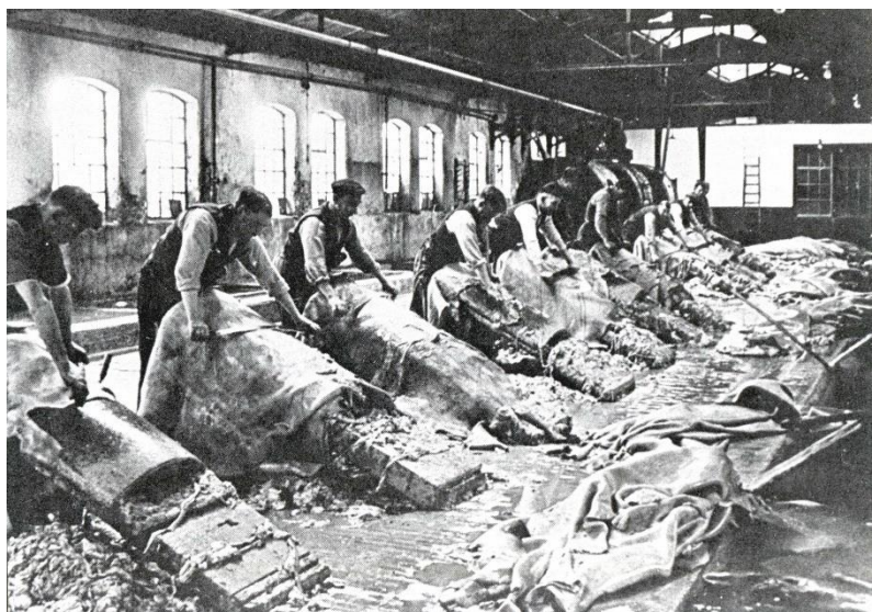
Handvlezers aan het werk op 'NV Lederfabriek Noord-Brabant' in de Julianastraat in Rijen

vakbondslidmaatschap of ontslag. Omdat de arbeiders kozen voor de vakbond werden ze op 12 februari 1917 met dertig tegelijk ontslagen. Er bleven zo op de ‘Nederlander’ onvoldoende mannen over om het werk te doen en de fabriek startte een wervingsactie. De bond deed toen een ernstig beroep op de looiersgezellen in Rijen en omgeving om op de ‘besmette’ fabriek geen ‘onderkruipdiensten’ te verrichten.