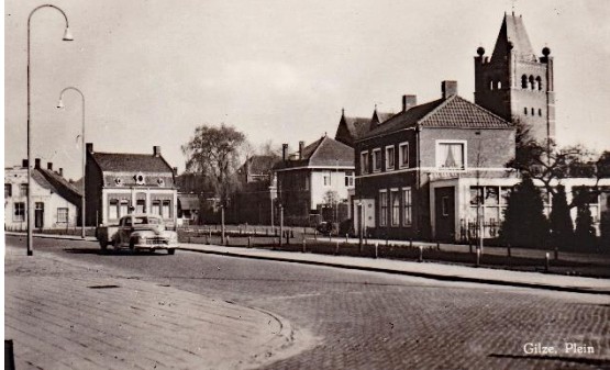
Het nieuwe Plein Gilze kort na 1956.