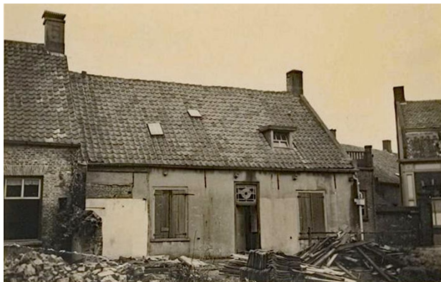
Afbraak oud postkantoor 1955