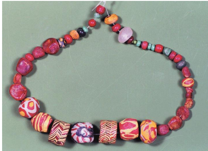
Kralenketting uit de Merovingische tijd, gevonden bij de opgravingen in 2001

Maar wat Gilze echt een stuk eerder in de tijd zette, waren honderd meter verderop de sporen in de grond van twee boerderijen uit de ijzertijd. Want dan praat je over de periode 800 tot 250 vóór Christus. De archeologen ontdekten er ook sporen van 'spiekers', gebouwtjes met een verhoogde vloer, die als opslagschuur voor akkerproducten dienst deden.