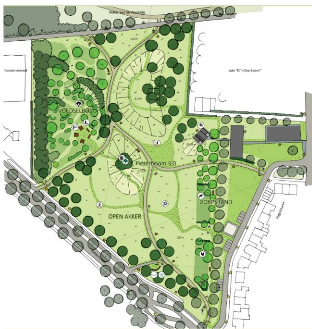
Plan landschapspark D'n Steenakker ontworpen door Barbara Roozen

Wandelend of fietsend langs Ridderstraat en Water aan de Warande zag je het de laatste maanden langzaam gebeuren. Met de aanleg van D'n Steenakker – 2,5 hectare groot – zijn we net buiten Gilze een mooi wijds landschapspark rijker. Niet alleen de naam van het park verwijst naar de historie, drie (nog kleine) zomerlindes op een heuvel brengen de heilige Pieterboom in herinnering die daar in vroeger tijden stond. En er valt nog veel meer te vertellen over wat er in deze omgeving allemaal voorbijtrok. Van Prinsen van Oranje tot Spinola en zijn Spaanse manschappen en van een neergestorte Engelse Hudson tot Merovingische kralen en paalsporen uit de IJzertijd. Lees hoe historisch de grond hier is en weet waar je loopt.