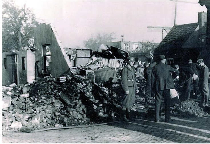
Hotel De Kronen

De familie Van Wezel was op dat moment in diepe slaap verzonken en bij de overburen, de familie Vermeulen in hotel De Kronen werden de laatste voorbereidingen getroffen om ook een einde aan de dag te maken. Toen brak de hel los. Een gierend geluid gevolgd door een daverende klap. Het toestel boorde zich in de woning van Van Wezel, alles met zich meesleurend wat er in was. Met woeste kracht sloegen de balken, dakpannen, stenen en stukken metaal ook door de ramen van het nabijgelegen De Kronen naar binnen