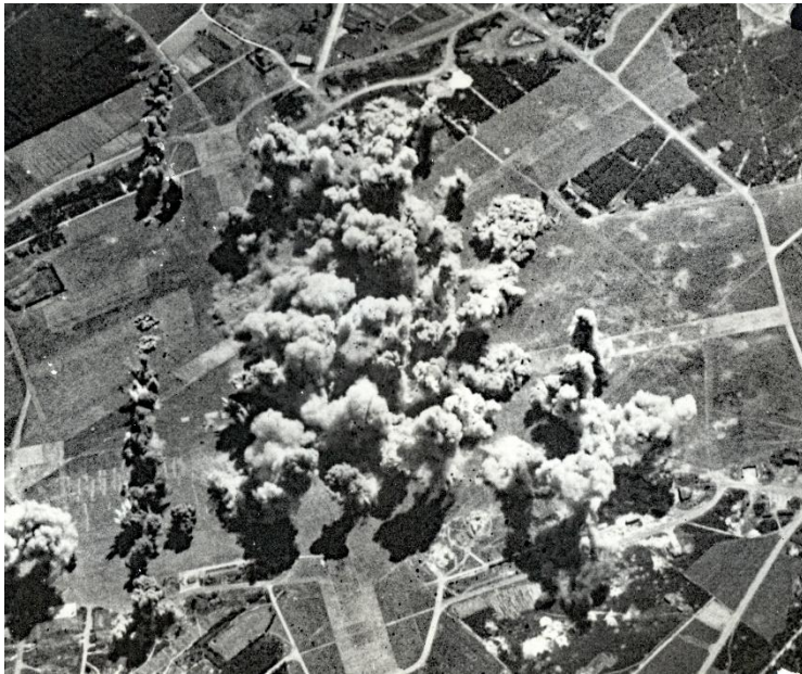
Bommen op het vliegveld

Elf doden uit Rijen, zeventien uit Hulten, vijf uit Molenschot en 55 uit Gilze. Dat was de droeve optelsom van vijf donkere oorlogsjaren. De kerkhoven geven nog steeds een indruk van het leed dat in de Tweede Wereldoorlog bij al die families is aangericht. In Gilze staat een speciaal monument en ook in Hulten liggen nog enkele oorlogsgraven. Namen, leeftijden en overlijdensdata spreken boekdelen. Maar ook de stompe kerktorenspits in Molenschot en de herdenkingskapelletjes in Rijen en op Verhoven herinneren ons nog aan deze periode.