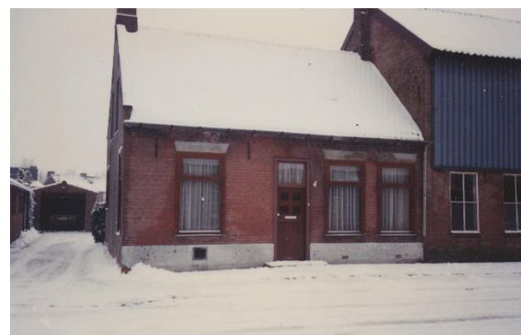
Het huis met daarnaast de looierij.

Vroeger waren de huiden allemaal gedroogd en die bij hen waren hele huiden. Ze hadden honderden huiden en ze moesten altijd precies opgeven wat ze hadden, maar dat had zijn vader dus niet gedaan. Die had bij boer Klaassen in de schuur een heleboel huiden verstopt en