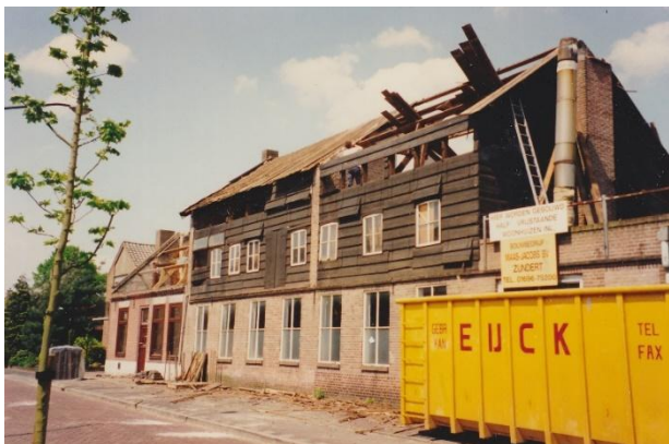
Het huis en de looierij zijn inmiddels gesloopt en er zijn nieuwe huizen gebouwd.