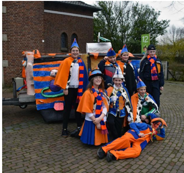
In februari 2020 extra groot feest in Hulten: de presentatie van de eerste prins en jeugdraad van het Krimpersgat

Corona komt voor iedere carnavalsliefhebber slecht uit, maar voor het Krimpersgat is het wel heel erg sneu. Al ruim dertig jaar trok er op de vrijdag vanuit de kleine school een vrolijke en kleurrijke kindercarnavalsstoet door het kleine Hulten. En juist vorig jaar haalden ze BN De Stem met de kop: 'Prins Krimp d'un Urste allereerste Prins Carnaval van 'Krimpersgat' Hulten' . Dankzij enthousiaste ouders en leerkrachten van basisschool De Drie Muskettiers hadden ze voor het eerst een eigen prins met jeugdraad. En ook uniek in de geschiedenis: het Krimpersgat kon de volgende dag, net als de andere drie dorpen, een prins met raad naar de jaarlijkse sleuteloverdracht door burgemeester en jeugdburgemeester afvaardigen. De Hultenaren moeten nu toch weer een jaartje wachten om dit een traditie te kunnen noemen. En ook daar geldt: geen creatieve bouwsels, geen feestelijke wagens, skelters en steps, geen familie en bekenden langs de kant.