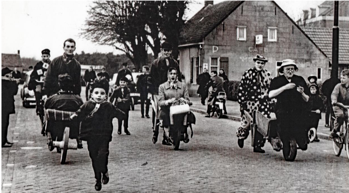
1965-Eerste keer Wijvesjouwen in het Dringersgat; nog steeds een van de succesnummers van de Leuttappers

ronde en keek of kasteleins en klanten zich aan de sluiting hielden. En owee als plotseling de cafédeur openging en hij 'hier is Willem' door het café galmde. Dan moesten de klanten zorgen dat ze heel gauw wegwamen en anders was hij wel bereid om een handje te helpen. Naar verluid ging deze veldwachter 'zo ongeveer gekleed als een Belgische politiemans met een naar achter hangende kepie, afgezet met zilveren galons (zilverdraad) en een sabel opzij'. Voor de duidelijkheid: hij droeg deze outfit niet alleen met vastenavond, maar ook in het gewone leven.