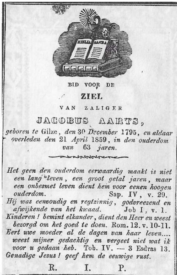
Een van de oudere bidprentjes is bijvoorbeeld dat van Jacobus Aarts, geboren in 1795 en in 1859 overleden in Gilze(nr.100.109)

uit Rijen zit in de dozen 40375 en 40376 en materiaal over de agrarische geschiedenis van Gilze en Rijen vind je in doos 40031. Voor wie belangstelling heeft zijn de dozen op dinsdagochtend – zodra de coronasluiting van het gebouw voorbij is – bij de heemkring in te zien.