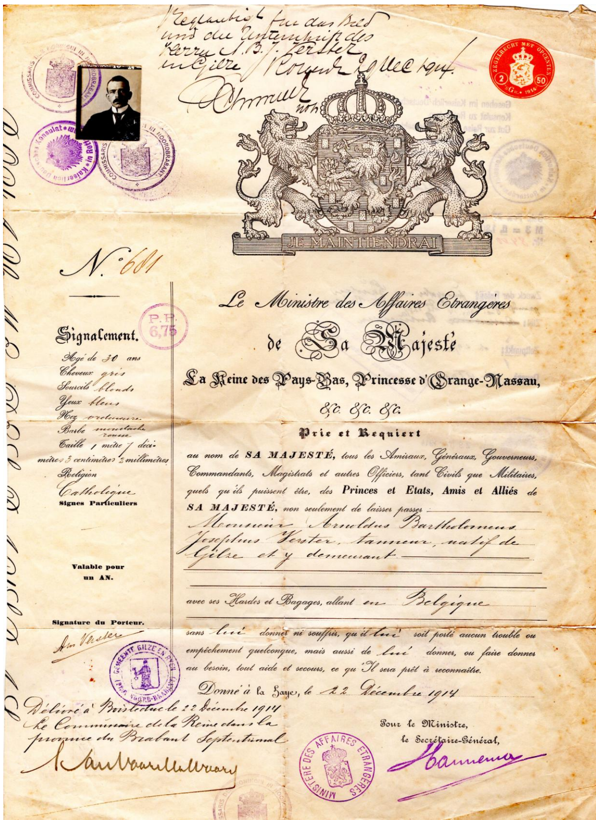
Voorbeeld van een gedigitaliseerd document: grensdocument Nederland – België uit 1914 van leerlooier Verster uit Gilze (nr.40899)