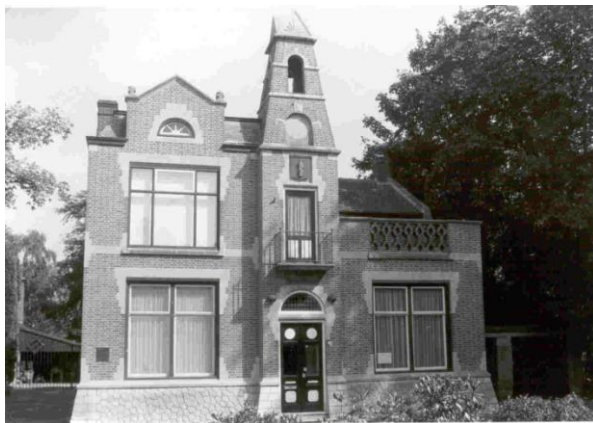
Het oude raadhuis aan de Nieuwstraat te Gilze, nu locatie van Heemkring Molenheide

Voor mensen die de oorlog bewust hebben meegemaakt is deze toelichting eigenlijk overbodig. Men heeft, bij wijze van spreken, dagelijks met de distributie te maken gehad. Toch spreekt, in het algemeen, het grote probleem van het in stand houden van de voedselvoorziening van de bevolking niet zo tot de verbeelding van de mensen. Dit is wel wat merkwaardig