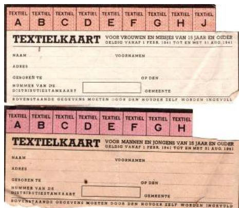
Textielkaarten voor mannen en vrouwen

De distributiedienst hield zich bezig met een pijnlijk nauwkeurige administratie van de vele distributiebescheiden. Alle bonnen, er waren vele soorten, alle stamkaarten, alle inlegvellen, alle aanvullingstoewijzingen, enz. moesten geteld, herteld, genoteerd, gebundeld, verzegeld en vooral verantwoord worden. Het was een waterdicht systeem met minimale fraudemogelijkheden. Bonkaarten werden vanuit Gilze in verzegelde kistjes onder politiebegeleiding naar de onder kring 240 vallende gemeenten gebracht. Kistjes die uit Baarle-Nassau terugkwamen, werden wel eens gebruikt voor het smokkelen van Belgische shag. De onder politiebegeleiding in verzegelde kistjes aangevoerde smokkelwaar werd op het kantoor in Gilze met een brievenweger in kleine porties van 20 of 30 gram verdeeld. De eigenlijke