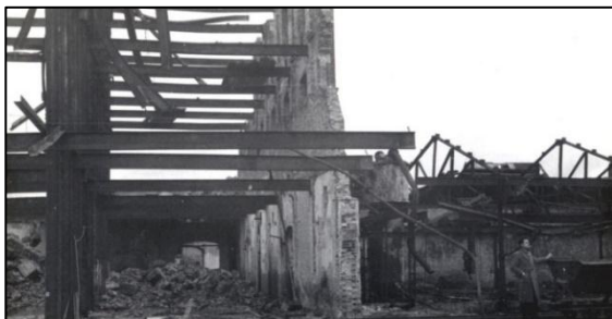
Lederfabriek Noord-Brabant na het bombardement van 3 september.

Dit werd een verschrikkelijke nooit te vergeten nacht. De Duitsers lieten diverse gebouwen de lucht in vliegen o.a. ging het patronaat, de bewaarschool, jongensschool, pastorie, lederfabriek Theeuwes, firma Smeekens, De Wijs, Marechausseekazerne, barakken der Duitsers en verschillende hofsteden in vlammen op. De ene brand na de andere aangekondigd door dynamietontploffingen volgde elkander op.