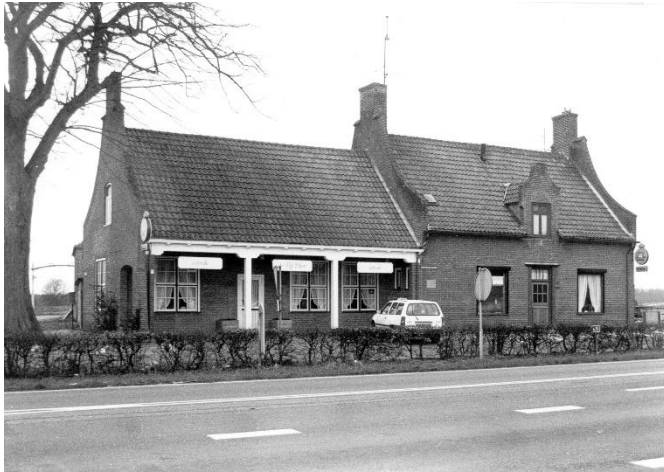
Café de Vijf Eiken, ca. 1980

De weg van Oosterhout naar Rijen wordt aangepast. De werkzaamheden, die in drie fasen worden uitgevoerd, zijn gestart. De provincie heeft daarvoor café De Vijf Eiken aangekocht. Het zalencomplex gaat plat, maar gelukkig blijft het oude pand behouden. Dat zijn we minimaal verschuldigd aan de bewogen geschiedenis van De Vijf Eiken.