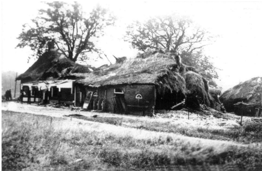
Het verwoeste pand van De Vijf Eiken, 30-07-1943