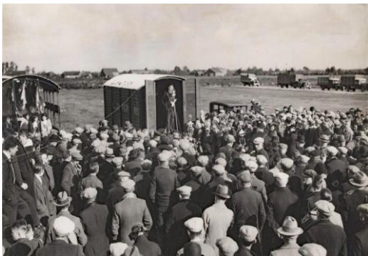
De veemarkt in Rijen rond 1950

de Rijense jaarmarkt een streep haalt? En door de kermissen in onze gemeente?