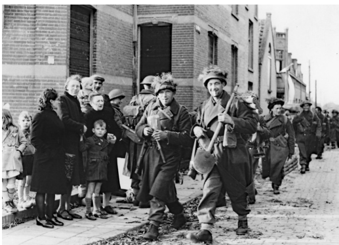
Bevrijding van Gilze