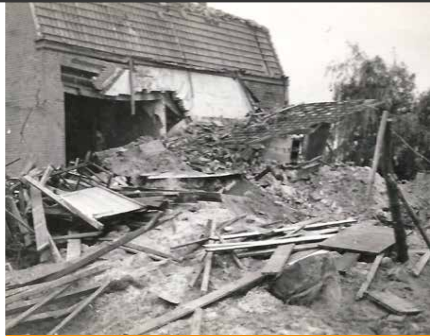
Ravage na het 'allereerste' bombardement op 5 juli 1944