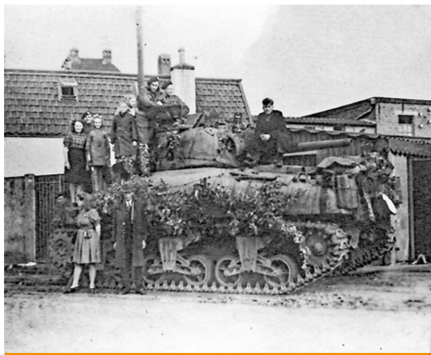
Engelse tank bij de bevrijding op 28 oktober 1944