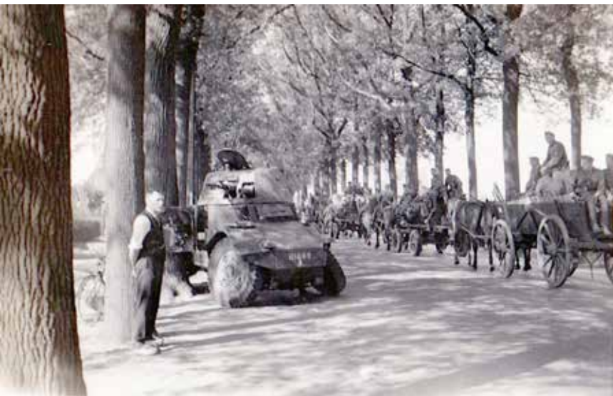
Duitse colonne op weg naar Breda over de Rijksweg op 13 mei 1940