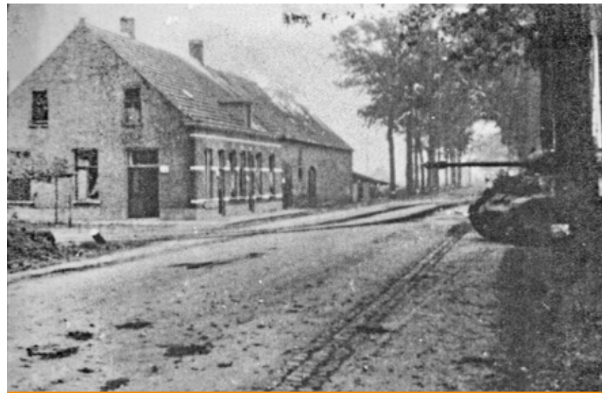
Een Poolse tank op de Rijksweg bij Stad Parijs op 28 oktober 1944