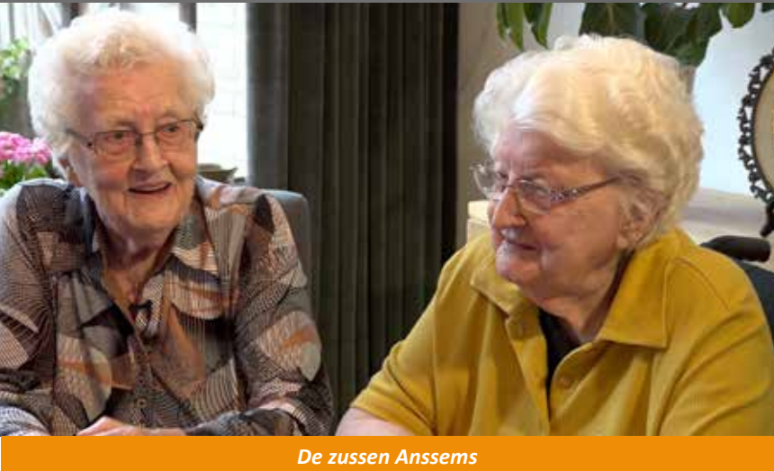
De zussen Anssems

Deze pagina is samengesteld door Heemkring Molenheide • Tekstredactie: Mariëlle van Hezewijk Fotoredactie: Piet Weterings • Opmaak: Weekblad Gilze en Rijen