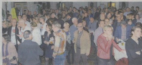
Grote belangstelling in het gemeentehuis voor de verkiezingen

De uitslag is nog officieus. De officiële uitslag zal op vrijdag bekend worden gemaakt. Welke personen voor de partijen zitting gaan nemen in de gemeenteraad is ook nog niet bekend, omdat ook de voorkeurstemmen nog geteld moeten worden.