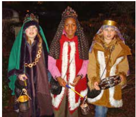
De drie koningen