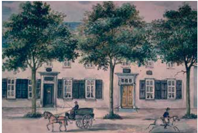
De IJzeren Eeuw

Het was ook een eeuw van sociale vooruitgang. Een voorbeeld is de invoering van de centrale klokkentijd in 1909. Verder de invoering van het kiesrecht voor mannen (1917) en vrouwen (1919)