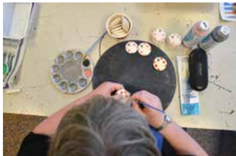
Een medewerkster van Artenzo werkt aan een Brabo, de Brabantse munt.

Commissaris van de Koning Wim van de Donk gaf als voorbeelden van deze waarden barmhartigheid, ingetogenheid en bescheidenheid. Het initiatief van de Brabantse Hoeders is ingegeven door het 'bruto nationaal geluk'. Dit idee komt van oorsprong uit het Himalaya-staatje Bhutan. Het 'bruto nationaal geluk' wordt onder meer bepaald door behoud en bevordering van culturele waarden, behoud van natuur en milieu, een goed bestuur van overheid en ondernemingen en het bevorderen van een duurzame sociaaleconomische ontwikkeling.