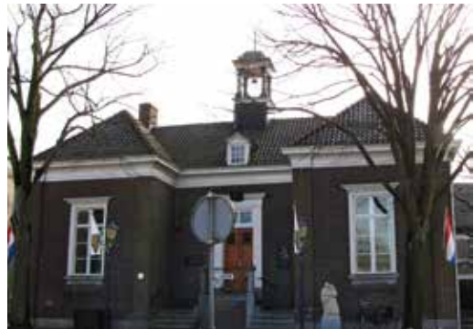
Het statige pand waarin Museum Zwaluws Erfgoed is gevestigd