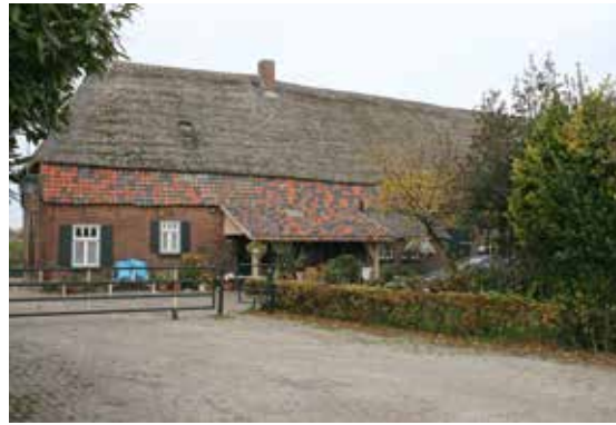
De Kartuizerhoeve aan de Goorestraat 1 in Boxtel

in het buurtschap Kleinder-Liempde te Boxtel gaat de door Ger van den Oetelaar geschreven publicatie. In het boek van 256 pagina's wordt aandacht besteed aan de geschiedenis van het kartuizerklooster Sint Sophia van Constantinopel in relatie tot deze hoeve. Kleinder Liempde, een buurtschap van Boxtel op de grens met (Groot) Liempde wordt beschreven. Veel aandacht gaat in het boek uit naar het bouwhistorisch onderzoek van de hoeve. Het door John van Lierop verrichte onderzoek is, ruim geïllustreerd, verwerkt.