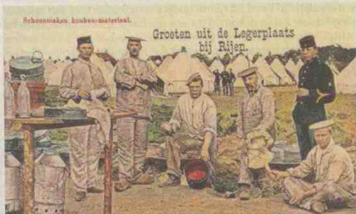
Prent over het legerkamp in Rijen (1914-1918).

Gilze en Rijen heeft zijn historische canon. Een keuze in boekvorm van de belangrijkste onderwerpen uit de historie van de vier dorpen van de gemeente. De canon omvat 21 korte verhalen die elk een apart thema aansnijden. Rijk geïllustreerd. Er staat eigenlijk alles in wat je als inwoner van de gemeente Gilze en Rijen zou moeten weten over de plaatselijke geschiedenis.