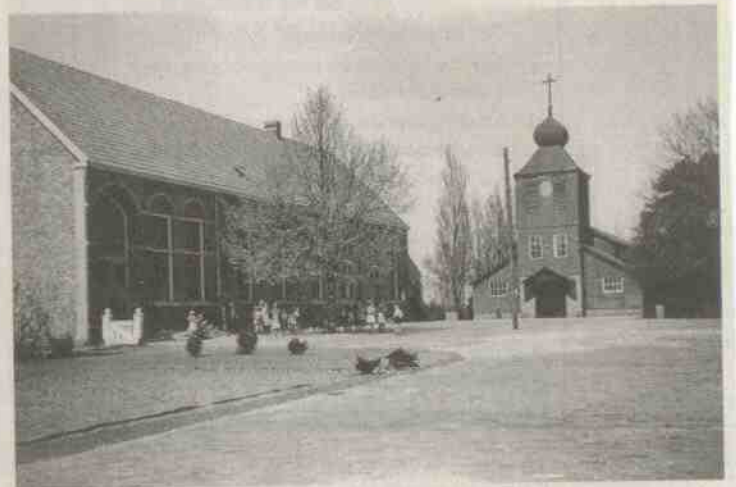
Houten noodkerk na de oorlog in Hulten.