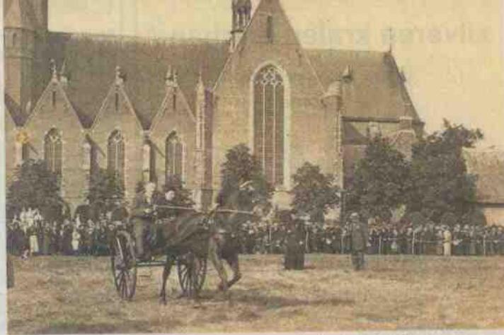
Eeuwfeest in 1918 rond de teruggave van de kerk in Gilze.