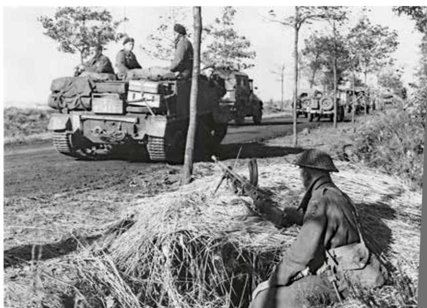
De Polen bij de bevrijding op 27 oktober 1944