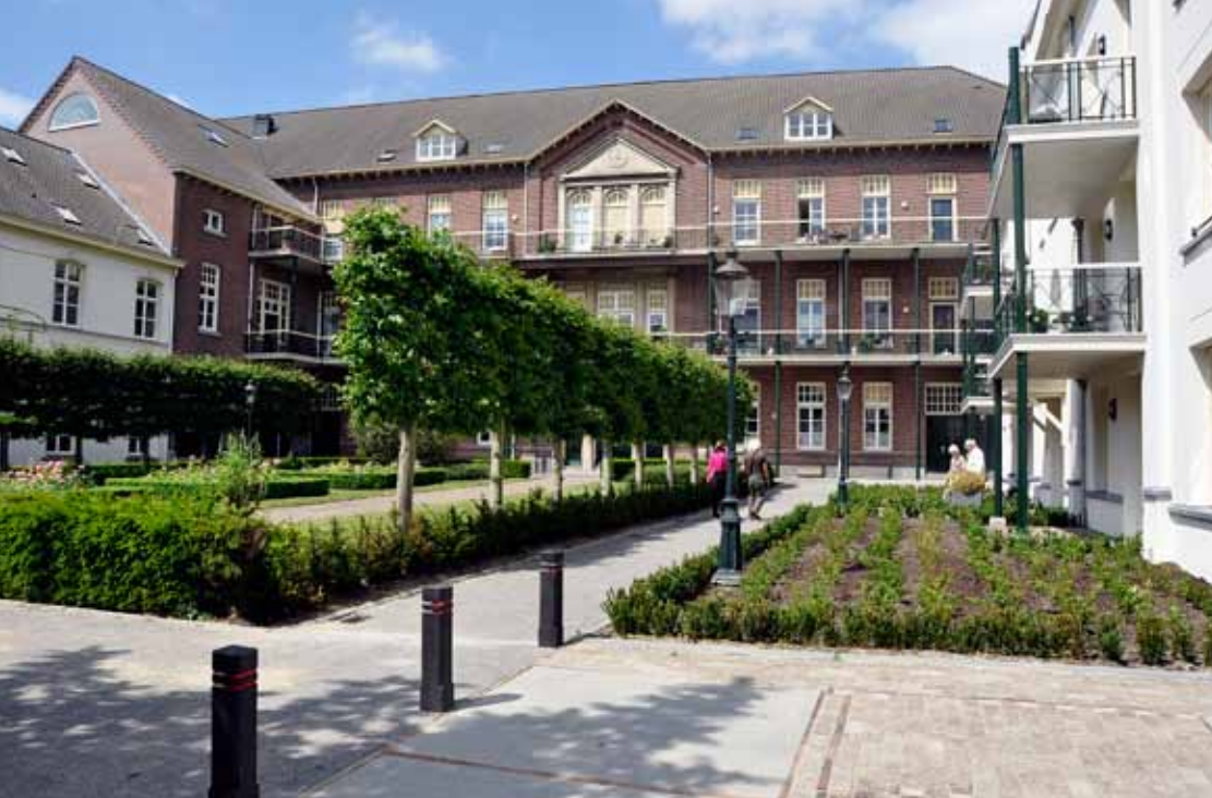
► Het klooster van de broeders van Oudenbosch.