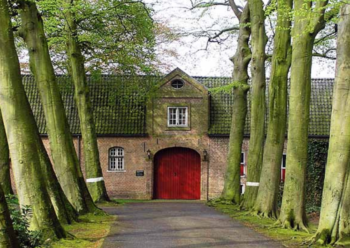
◀ Wilhelmietenklooster, Huijbergen, nu broeders van Huijbergen.