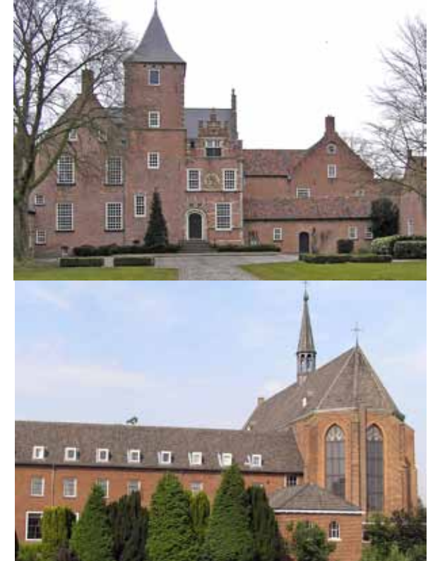
▶ Sint-Agatha, Kruisheren, Cuijk.

Behalve deze twee wisten op het Brabantse land nog een twaalfstal kloosters te overleven en wel omdat ze gevestigd waren in of uitgeweken waren naar enclaves in de provincie die tot 1800 niet bij de Republiek der Zeven Verenigde Nederlanden behoorden. We hebben het dan over het Graafschap Megen, het land van Ravenstein, de baronie van Boxmeer en de commanderij Gemert. In deze katholieke Brabantse enclaves overleefden de volgende tien kloosterorganisaties de ‘protestantse furie’: de Kruisheren (Uden), de Kapucijnen (Velp), de Franciscanen (Megen), de Karmelieten (Boxmeer), de broeders Penitenten (Boekel/Huize Padua), de Birgittinessen (Uden), de Clarissen (Megen), de Augustinessen (Deursen), de Penitenten (Haren) en de Karmelietessen (Boxmeer). Twijfelgevallen zijn de Duitse Orde (Gemert) en de Wilhelmieten (Huijbergen), want de kloosterlijke vrijheid in Gemert werd enige tijd onderbroken, omdat de Staten Generaal het gebied tussen 1648 en 1662 bezet hield en omdat van Huijbergen was niet duidelijk tot welk grondgebied het hoorde.