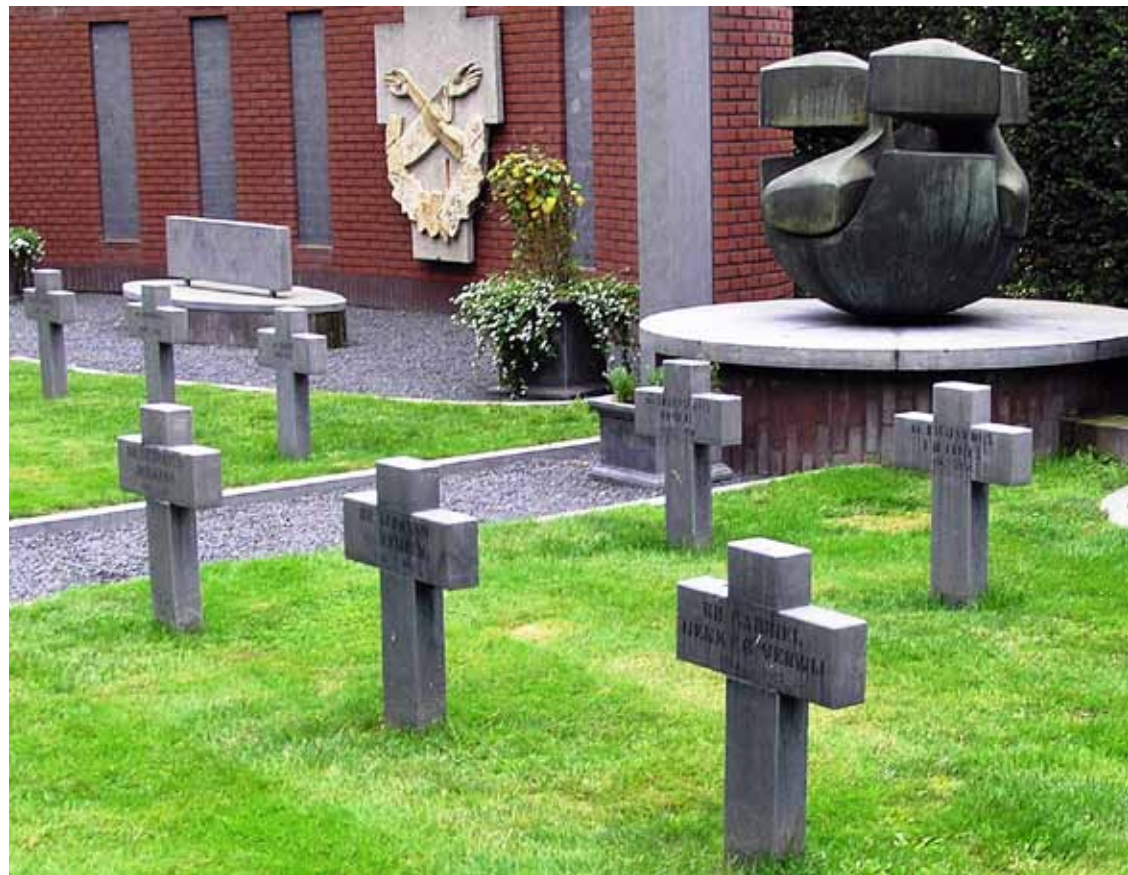
▲ Monumentaal kerkhof Broeders van Boekel naast parochiekerkhof Handel.

Berne (Norbertijnen) in Heeswijk. In zowat alle gevallen liggen de kloosterlingen begraven op terreinen die eigendom van hun kloosters of van door hen opgerichte stichtingen zijn. Dat biedt de garantie dat deze graven in beginsel niet na verloop van tijd automatisch geruimd worden.