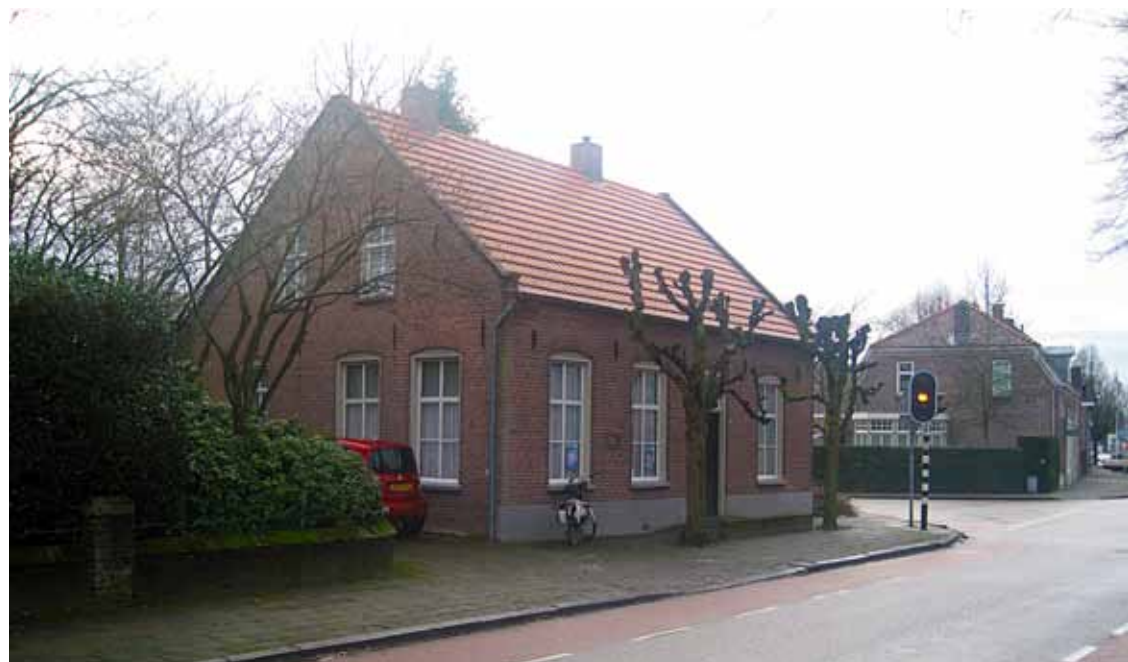
🏠 Het heemhuis aan de Stationsstraat in Deurne.

demonstratie een bestuurslid van volleybalvereniging Livoc uit Liessel binnenkomt. De club viert dit jaar haar 50-jarig bestaan en wil graag weten of de heemkundekring informatie heeft over de geschiedenis. En die is er inderdaad, al is het over deze club nog tamelijk beperkt. Het biedt de drie beheerders een mooie kans om in heel DeurneWiki te kijken naar wat er bekend is over de volleybalvereniging.