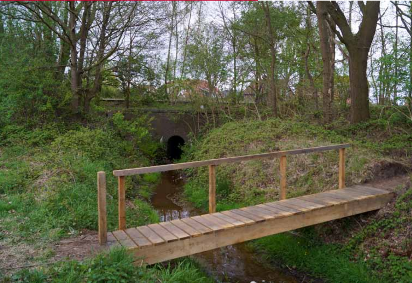
🏠 Het bruggetje bij de overkluizing.