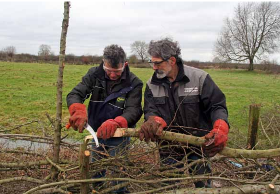
Maasheggen vlechten is een beroep dat belangrijk is voor het landschap.