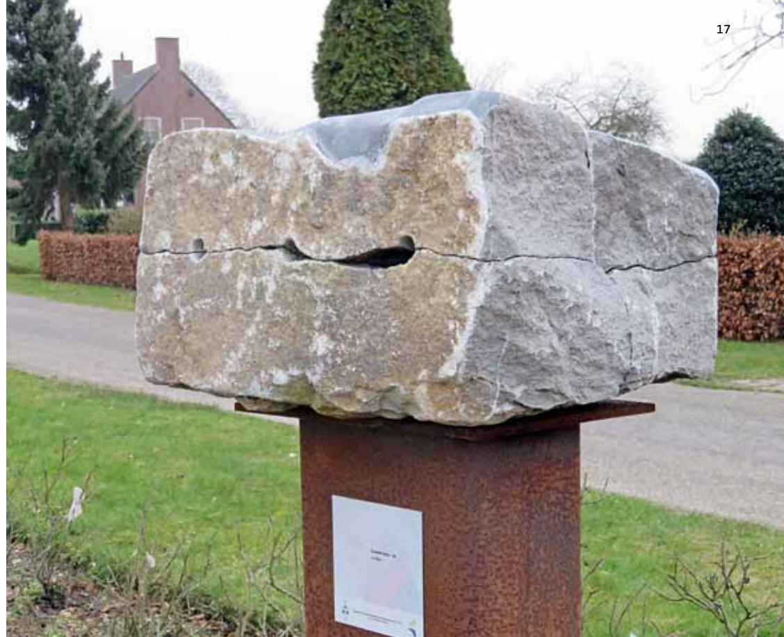
🏠 Dubbele breuk.

Gijsen was een markante beeldhouwer, hij maakte geen gebruik van zijn materiaal; hij benutte de mogelijkheden die de steen hem bood. Inclusief alle barsten, breuken en verkleuringen. Het is de ware beeldhouwer die dat soort toevalligheden als cadeautjes beschouwt. Toeval lijkt dan bijna niet meer te bestaan, het is een afgedwongen toeval dat Jo Gijsen zijn stenen oplegde.