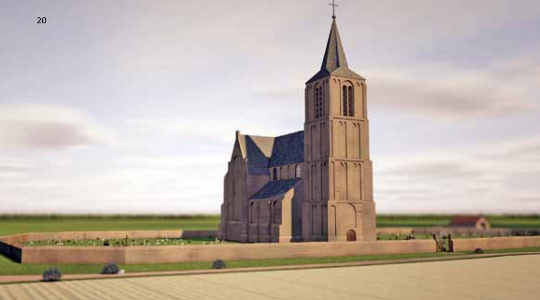
Reconstructie van de middeleeuwse kerk op de Tomakker in Nuenen.