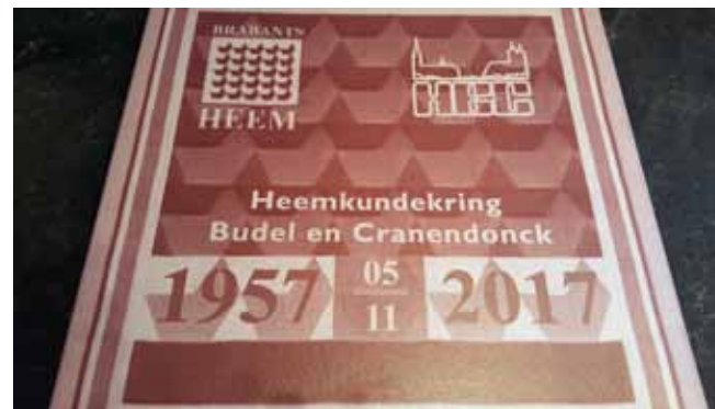
◀ De jubilerende vereniging kreeg de geweven doek van Brabants Heem aangeboden.

voormalige Willem II fabriek en MAVO, het terrein naast de kerk (waar maar liefst drie boomstamputten werden gevonden), op de Markt bij het Schepenhuis en enige jaren geleden de nederzetting uit de Romeinse tijd op het terrein van de Duitse school. Zeven jaar lang was hij met anderen een van de drijvende krachten achter de prachtige maquette van Budel anno 1832, die nu de secretariëkamer van de heemkundekring siert. En verder was hij vanaf het begin in 1997 actief in de werkgroep Genealogie en de laatste jaren vormt hij vooral het lopend geheugen van Budel binnen de fotowerkgroep.