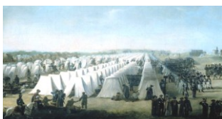
Rijen zuid in 1831

Rijen kreeg door de Belgische Opstand vanaf 1830 te maken met inkwartieringen (tot 1839). Behalve dat er manschappen gelegerd waren in het Kamp van Rijen, werden er ook troepen in alle dorpen van de gemeente ingekwartierd. Tot aan 1835 lag het gemiddeld aantal ingekwartierde militairen tussen 500 en 600. Tussen 1835 en 1839 nam dit aantal af tot 150 à 200 militairen. Op enkele uitzonderingen na, kon niemand binnen de gemeente zich onttrekken aan de last van de inkwartieringen. Als tegemoetkoming in de kosten kregen inwoners voor verhuur van alleen een bed, een vergoeding van 3/16 cent per man per dag. Bij volledige kost en inwoning werd 35 cent per man per dag gerekend. Was er in huis geen plaats, dan mochten de militairen ook in schuur of stal slapen. Wel moesten ze een hoofdkussen, schone lakens en een deken krijgen. In de winter waren dat twee dekens.