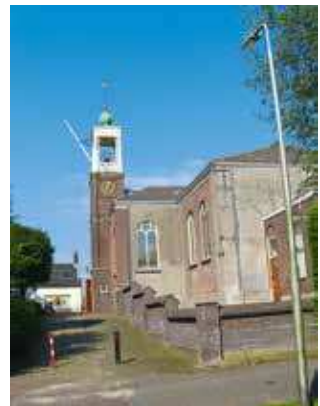
De kerk van Lage Zwaluwe

In het boek komt ook de tegenstelling tussen Hooge en Lage Zwaluwe aan bod. Vroeger moesten de mensen uit Lage Zwaluwe naar Hooge Zwaluwe om te kerken, alhoewel de predikant soms ook naar Lage Zwaluwe kwam. Dit gaf onenigheid tussen beide kerken, zodat