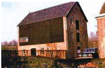
Het pand Heuvel 20 in Dongen rond 1970