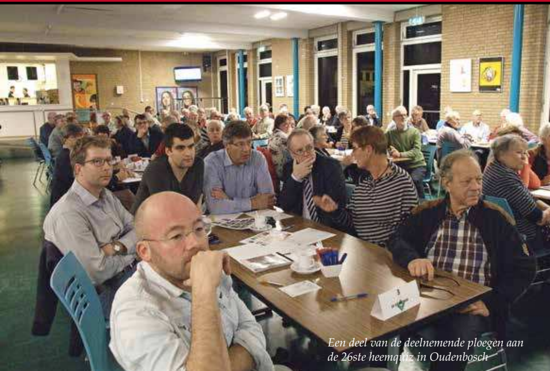
Een deel van de deelnemende ploegen aan de 26ste heemquiz in Oudenbosch