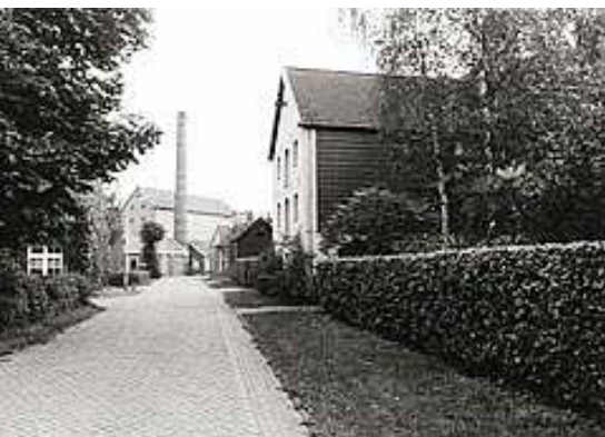
De Heuvel op een foto rond 1920