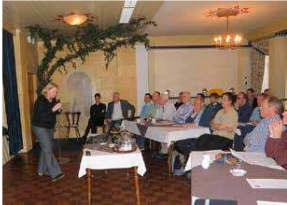
Ruim 120 belangstellenden luisterden op de studiedag van de NBAG naar zes verschillende lezingen