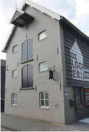
Ledermuseum 'De Looierij' aan de Kerkstraat in Dongen

nomische crisis hield tot 1936 aan. Na de beëindiging van deze mondiale crisis en de Tweede Wereldoorlog in 1945, bloeit de leerindustrie weer op als van ouds. Wel waren er slechts 15 fabrieken in Dongen en 42 in Rijen na de oorlog overgebleven. Een deel van alle leerproductie werd verwerkt tot schoenen. Op haar hoogtepunt in 1965, waren er vrijwel 20.000 mensen direct werkzaam in de Nederlandse schoenenindustrie. In de jaren zestig gaat het dan snel bergafwaarts met de productie en de afzet. Vooral vanuit Italië komt steeds meer goedkoper en kwalitatief beter leer op de markt.