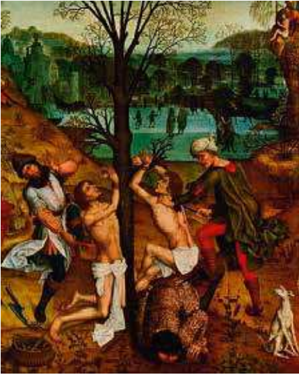
De martelaren Crispinus en Crispinianus die later patroonheiligen van de leerlooiers, schoenmakers en orthodontisten werden

beterd. In 1848 werd de looiende werking van chroomzouten ontdekt. Looiers gingen al snel over tot het gebruik van deze chroomlooistoffen en rond de eeuwwisseling was de chroomlooiing minstens zo belangrijk als de plantaardige. Chroomlooiing is een sneller procedé, dat vooral voor bovenleder geschikt is. In de twintigste eeuw werd het looiproces steeds meer gemechaniseerd – daarop wordt hier niet nader ingegaan. De Frans-Duitse oorlog van 1870 tot 1871 leidt tot een grote vraag naar leerproducten en dus tot grote voorspoed in Dongen. Enige tijd later is er wederom sprake van een neergang in deze bedrijvigheid. Pas vanaf 1875 ontstonden er leerlooierijen op industriële basis door de uitvinding van de looivaten en het gebruik