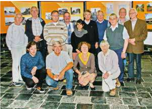
De vrijwilligers van Oudheidkundige Kring 'Geertruidenberghe' die hielpen om de tentoonstelling in te richten en die tot een goed einde te brengen.

Deze Langstraatspoorlijn-expositie heeft zich dit jaar in een overweldigende belangstelling mogen verheugen. De teller kwam uiteindelijk uit op ruim 5500 bezoekers. Die bezoekers kwamen van heinde en verre, zelfs uit het buitenland, maar ook uit de Achterhoek, Twente, De Peel, Alkmaar, Hoorn, en uiteraard uit de eigen regio. Het was een gemêleerd gezelschap: mensen die zich de spoorlijn nog heel goed herinnerden van vroeger, jongeren die uit overlevering veel van ouders of grootouders over de vroegere lijn hadden gehoord, spoor- en treinliefhebbers en schoolklassen. Veel belangstelling was er ook voor de mogelijk nieuwe bestemming van de nog aanwezige oude draibare spoorbrug, tot een Park-over-Water, en het doortrekken van de fietsroute, Halve Zolen pad genaamd, over de spoordijk van Raamsdonk naar Lage Zwaluwe. Een animatiefilm over het deel van de route dat nog aangelegd moet worden, sprak zeer tot de verbeelding.