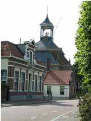
De kerk van Hooge Zwaluwe

HOOG ZWALUWE – In de afgelopen periode is het boek 'Uren, dagen, maanden, jaren' verschenen. In dit boek wordt de geschiedenis van de Protestantse (hervormde) kerken van Hooge en Lage Zwaluwe beschreven.