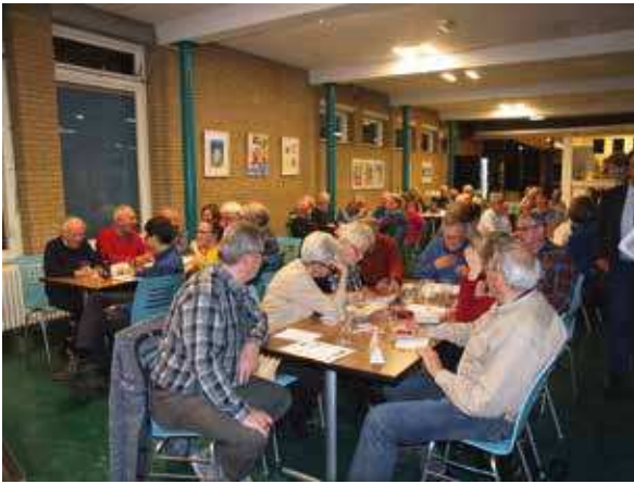
Hard werken tijdens de regionale quiz in Oudenbosch

zet kon worden op één van de tien categorieën zorgde voor dubbele punten voor die vraag. De eerste vraag van elke serie was steeds een oud televisiefragment, waarbij programma's als 'Stiefbeen en zoon', 'Schipper naast Mathilde' en 'Pension Hommes' de revue passeerden. Terugkerende rubrieken waren ook West-Brabantse bruggen en havens,