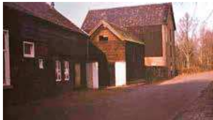
Het runhuisje dat omstreeks 1890 gebouwd werd voor de opslag van eikenschors tussen Heuvel 16 en Heuvel 20. (Foto uit 1970)