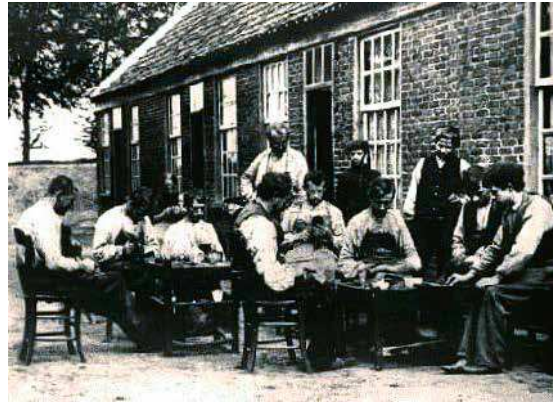
Thuiswerkende schoenmakers in de 'Goudmijn' rond 1910. De naam 'Goudmijn' was spottend gekozen, want de schoenmakers kregen slechts een schamel loon