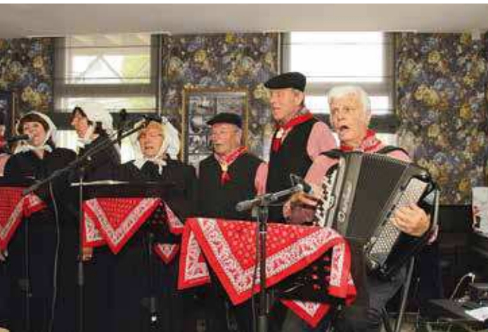
Een foto gemaakt tijdens het vorige dialectenfestival

De liedtekst moet ingestuurd worden samen met een geluidsopname daarvan. Wat de verhalen betreft, hiervoor geldt een maximale omvang van 1000 woorden; voor de gedichten is dit één A4. Het verhaal, het gedicht of de liedtekst waarmee u wilt deelnemen, moet gebaseerd zijn op bovengenoemd thema en geschreven in uw eigen Brabants dia-