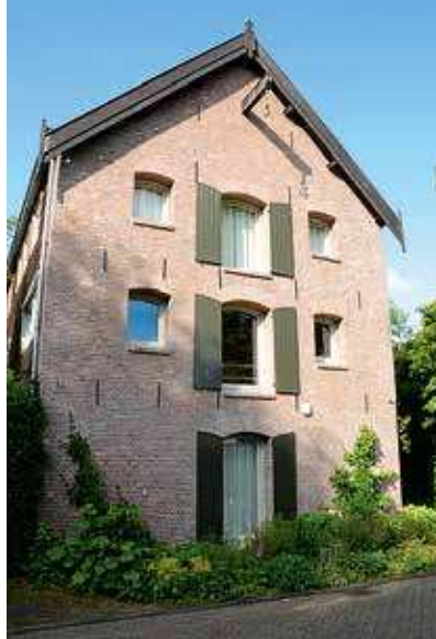
Zo ziet het pand Heuvel 20 er anno 2015 uit

Meer informatie op website: www.cbsm.nl . Het volledige artikel is te vinden op www.brabantsheem.nl .