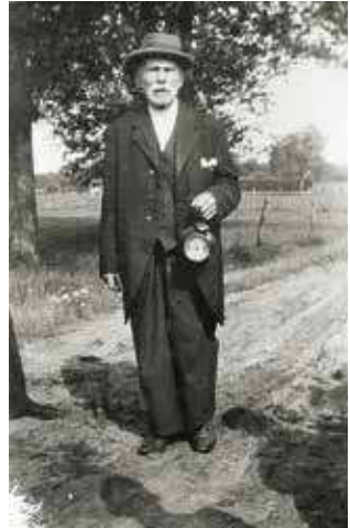
Met deze foto opent de nieuw aangesloten stichting haar website

Wij heten vanaf deze plaats de Stichting 'De oude schoenendoos' van harte welkom bij Brabants Heem.