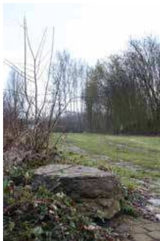
De Steenbergse duivelssteen

vingswereld. Een tijd toen de mensen nog niet overspoeld werden met allerhande wetenschappelijke waarheden. De mensen waren toen, door onze ogen bezien, misschien naïef en niet erg geleerd. Anders geredeneerd zagen ze misschien juist meer dan wij en hebben we door onze levensstijl en overtuigingen geen oog meer voor de niet-stoffelijke wereld. Wie kent de realiteit van wat we niet kunnen zien? De Jong combineert het mystieke van de verhalen en sagen met feitelijke informatie op basis van archiefbronnen en de literatuur. De combinatie maakt het boekje erg leesbaar voor een heel breed publiek met zowel een historische interesse als voor liefhebbers van gewoon een leuk verhaal.