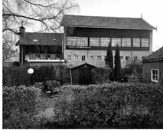
Vermeulen Looierij & Schoenmakerij sinds 1784. In het gebouw zijn nu appartementen ondergebracht

Een verbetering van het looiproces vormde de vache-lissé-looiing, waarbij plantenextracten met een zeer hoog gehalte aan looistoffen werden gebruikt. Vooral het looien van zool- en drijfriemleder werd erdoor versneld en ver-