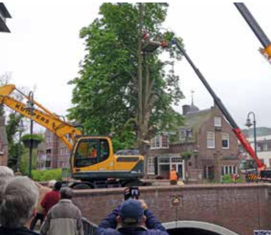
De oude kastanje wordt omgehaald