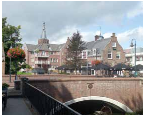
De jonge rode beuk op de plek bij de Dommelbrug