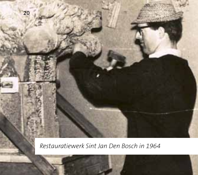
Restauratiewerk Sint Jan Den Bosch in 1964