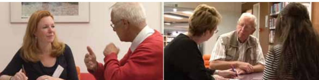
Mensen vertellen hun persoonlijk verhaal

Uit de vele opgehaalde verhalen worden er 75 gekozen. Verspreid over de hele provincie Noord-Brabant. Zij bevatten een 'crossroadsmoment', een keerpunt of leven veranderend element. De ambitie van het project Crossroads is het raken van mensen van nu, met die keerpunten van toen. NHTV Breda Lectoraat Storytelling ontwikkelde hiervoor een concept. Door de crossroadsverhalen volgens de techniek van storytelling op te schrijven, worden ze onderhoudend en informatief. Ze zijn daardoor goed te presenteren aan het publiek.