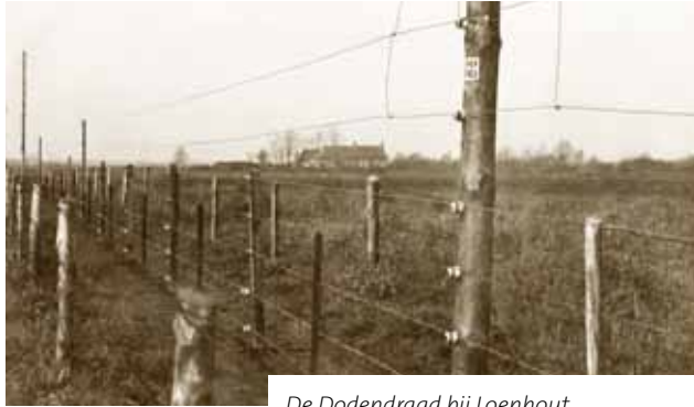
De Dodendraad bij Loenhout

Een pilot van het erfgoedproject 'De Dodendraad Leeft' werd in 2015 met succes uitgevoerd op de grens tussen Zundert en Wuustwezel. Daar werd een lint van 11 kilometer met 25.000 witte krokussen beplant door schoolkinderen en grensstreekbewoners. Ook de gamecommunity van geocachers hielp met het planten van de bolletjes waardoor er een heel nieuwe doelgroep voor erfgoed werd bereikt. Na afloop van de pilot werd een draaiboek samengesteld waarmee de grensgemeenten zelf aan de slag kunnen met het project. Het draaiboek is te zien op http://www.verhalis.nl/pdf/draaiboekdodendraad.pdf