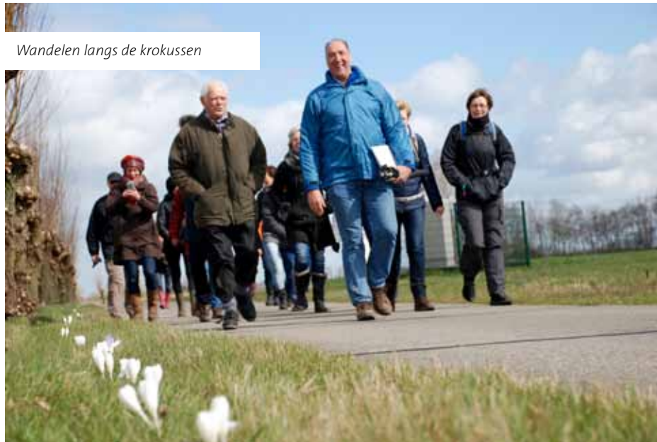
Wandelen langs de krokussen