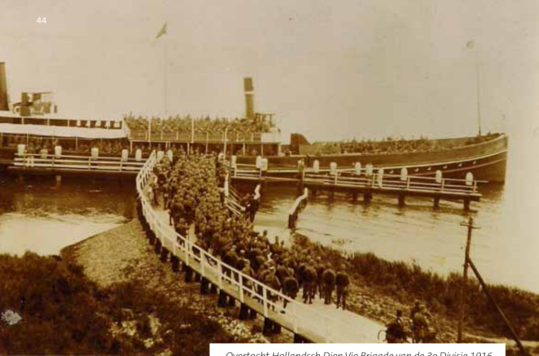
Overtocht Hollandsch Diep Vie Brigade van de 3e Divisie 1916