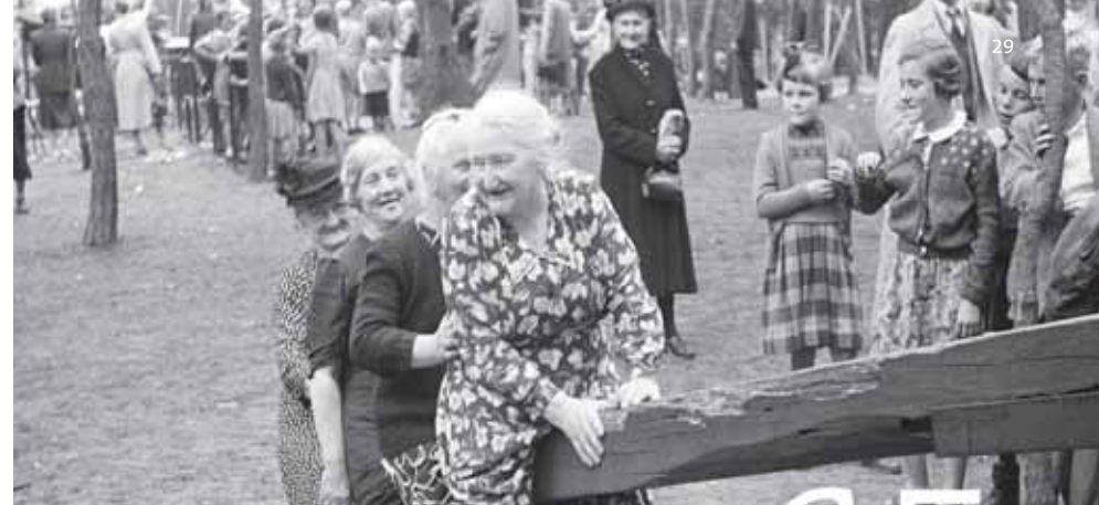
Osse ouderen op de wip in De Efteling

Het boek WATER en BROOD is te koop voor € 22,50 via Pictures Publishers www.picturespublishers.nl en bij Bezoekerscentrum D'n Liempdsen Herd, Barriereweg 4 te Liempde. ■