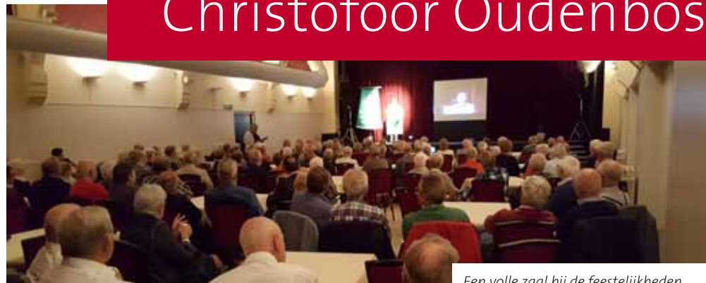
Een volle zaal bij de feestelijkheden

Heemkundige Kring Broeder Christoffor uit Oudenbosch heeft het 30-jarig bestaan gevierd. Het werd een drukbezochte feestdag in Fidei et Arti.