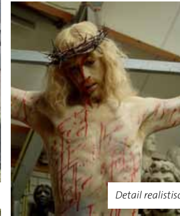
Detail realistisch kruisbeeld