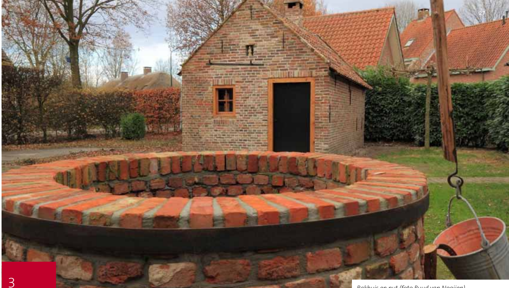
Bakhuis en put

Het boek 'Daer uijt hanght Den Eijngel' is te koop voor € 22,50 via Pictures Publishers www.picturespublishers.nl en bij Bezoekerscentrum D'n Liempdsen Herd, Barrieweg 4 te Liempde. ■