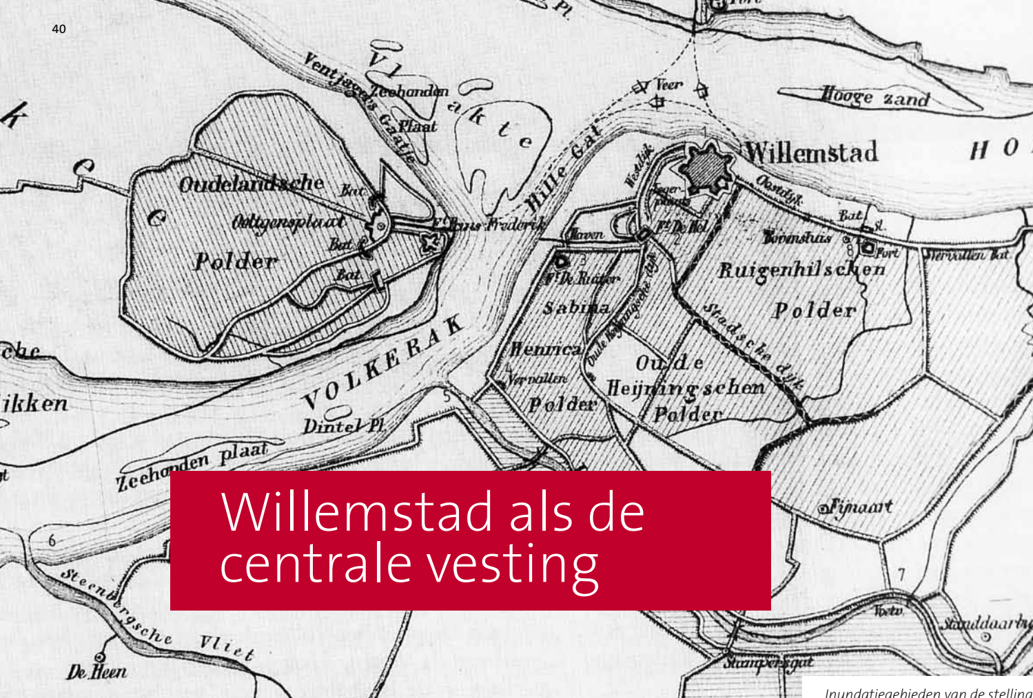
Inundatiegebieden van de stelling