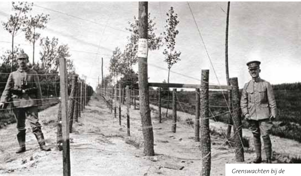
Grenswachten bij de Dodendraad

Tijdens de evaluatie van die middag toonden veel deelnemers interesse in deelname aan het project 'de Dodendraad leeft'. Er werden met sommige vertegenwoordigers van gemeentes en heemkundekringen al concrete afspraken gemaakt. De komende maanden worden op een aantal plaatsen regionale bijeenkomsten georganiseerd om met de betrokken en geïnteresseerde instanties een regionale samenwerking tot stand te brengen aan beide zijden van de grens.