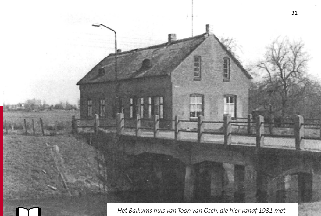
Het Balkums huis van Toon van Osch, die hier vanaf 1931 met zijn gezin woonde. Het pand is in de jaren '70 gesloopt.