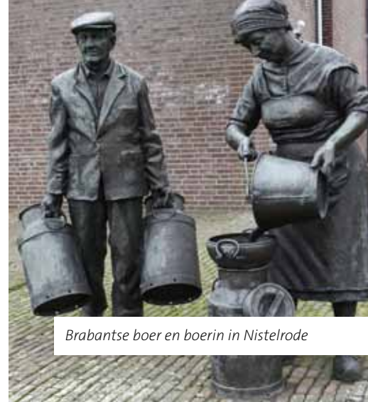
Brabantse boer en boerin in Nistelrode