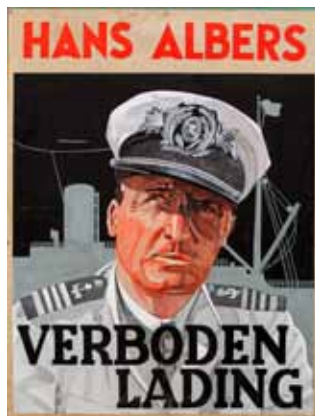
Affiche Toon Grassens voor de LTS Veghel